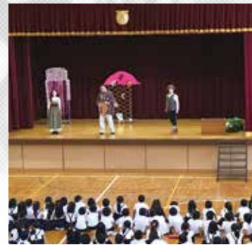
学校での芸術観賞(オペラ)