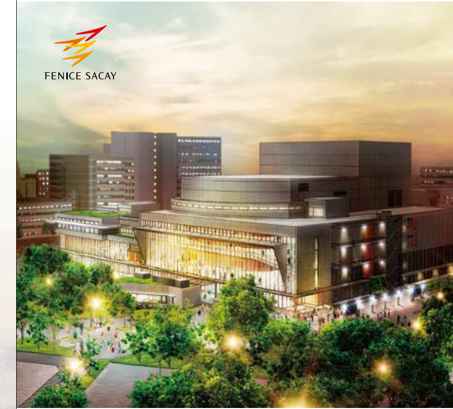
「フェニーチェ堺(堺市民芸術文化ホール)」2019年秋グランドオープン