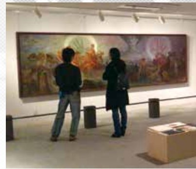
アルフォンソ・ミュシャコレクションの企画展示