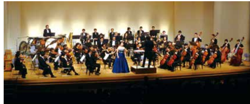
若手アーティストとオーケストラの共演