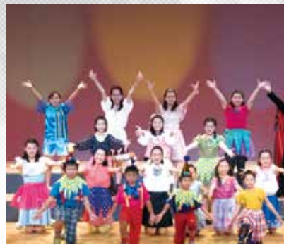
堺市少年少女合唱団・堺リープズハーモニーの育成